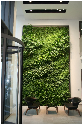
Le mur végétalisé du site de Cologne

considérablement améliorée depuis 2009. Début 2017, plus de 50 % des salariés de SCOR travaillaient ainsi dans des bureaux « verts », c'est-à-dire dotés d'un système de gestion environnementale certifié. A Paris, Londres, Cologne, Zurich ou Singapour, les bureaux occupés par le personnel ont tous reçu un label de performance énergétique ou une certification environnementale (HQE, BREEAM pour la construction/le fonctionnement, EMAS, ISO 14001, etc.) et SCOR entend poursuivre cette démarche.