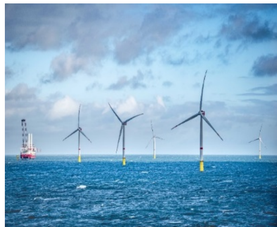
Projet Veja Mate – Énergie éolienne en mer – Allemagne

Tandis que SCOR élabore des couvertures d'assurance pour la production d'énergies renouvelables (comme les énergies solaires), le Groupe investit également à grande échelle dans des projets d'énergies renouvelables et dans la construction de bâtiments de haute qualité environnementale. La majeure partie du portefeuille immobilier de SCOR (immeubles en usage propre compris) répond d'ores et déjà aux normes de performance énergétique (« bas carbone »).