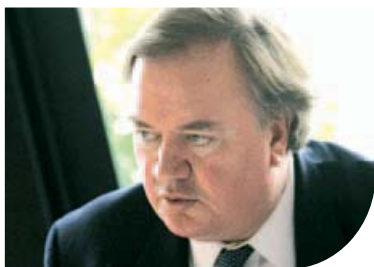
Denis Kessler Président-Directeur général de SCOR

9-12 SEPTEMBRE 2007 : SCOR présente son plan de souscription 2008 avec une équipe unifiée lors des Rendez-Vous de Septembre à Monte Carlo. L'intégration financière et comptable aura lieu dès le troisième trimestre 2007.